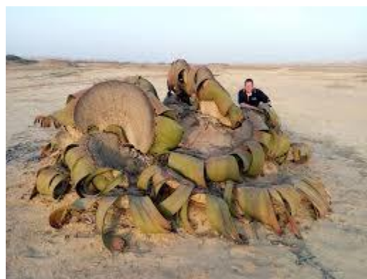
экземпляр 4000 лет