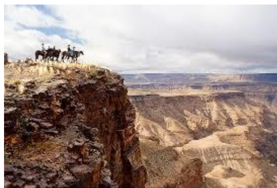
Fish River Canyon