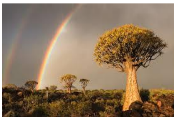
Quiver tree forest